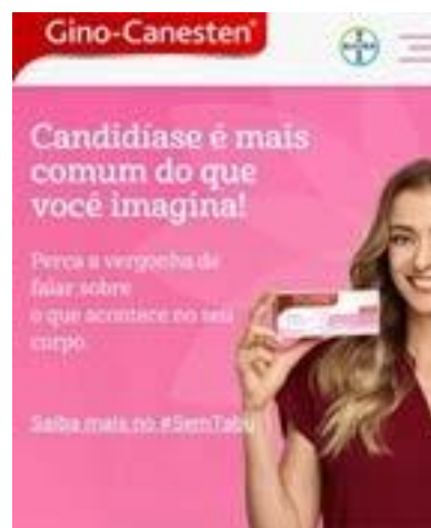
Figura 1: Peça publicitária de Gino-Canesten

“Você sabe que eu não tenho vergonha de falar nada, né? Por isso eu tô aqui, pra falar de um assunto que ninguém deveria ter vergonha: Candidíase, que dá aquela coceirinha, corrimento, sabe? Situação chata, que atinge três em cada quatro mulheres; mas Gino-Canesten, resolve de forma simples em uma só aplicação, dá nem tempo de sentir vergonha. Gino-Canesten é um comprimido vaginal que resolve a candidíase em uma só aplicação. Gino-Canesten, agora esse cuidado íntimo está em suas mãos. Se é Bayer é bom. Gino-Canesten é um medicamento, seu uso pode trazer riscos. Procure o médico e o farmacêutico. Leia a bula. Se persistirem os sintomas, um médico deverá ser consultado.