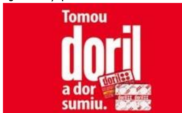
Figura 2: Peça publicitária de Doril