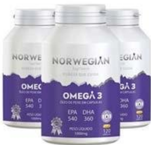
Figura 3: Peça Publicitária de Norwegian Ômega 3

Saúde para o Coração O Norwegian Ômega 3 Sem Sabor e Sem Odor é extraído da cidade de Ålesund, na Noruega,